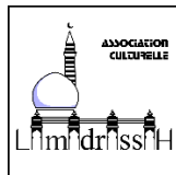
La Madrassah Paris