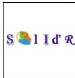
Solid'R Le Kremlin Bicêtre