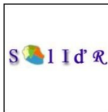
Solid'R Le Kremlin Bicêtre